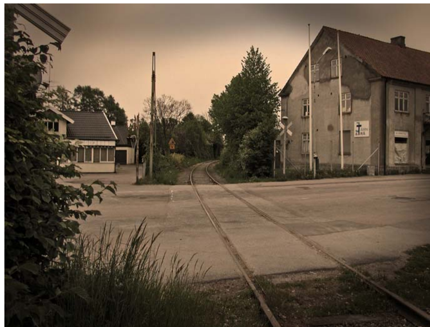
Efter att järnvägen delat sig svänger spåret åt höger bort mot Findus. Eftersom det sällan kommer tåg på den här järnvägen används den ofta som promenadstig.

Men trädgården hade en gräsplätt och mitt i fanns ett klätterträd. Dessutom kände bröderna till Bjuv lite, så för första gången sedan de kom till Sverige behövde de inte flytta till en helt ny, okänd plats.