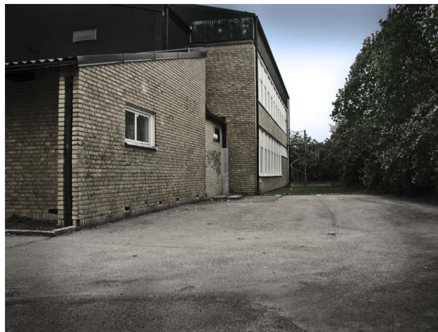
Platsen bakom skolans norra gavel var ett populärt tillhåll för dem som ville smygröka eller klottra på väggen. En tid efter mordet bestämde skolans rektor att väggen skulle tvättas ren från graffiti och behandlas med ett medel så att det inte gick att spreja på den igen.